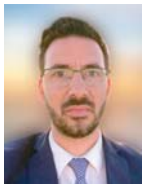
Γράφει ο Σπύρος Μουρελάτος