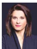
Γράφει η Αμαλία Κάζου

Με τις νέες ρυθμίσεις για τα δάνεια των μικρομεσαίων οι τράπεζες θα πρέπει υποχρεωτικά, στην περίπτωση ρύθμισης μη εξυπηρετούμενου δανείου, να παρέ-