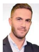
Γράφει ο Σταύρος Ιωαννίδης

Στη συνάντηση με τον Ισραηλινό ΥΠ.ΕΞ. Γκαμπί Ασκενάζι ο Νίκος Δένδιας καταδίκασε με απόλυτο τρόπο τις επιθέσεις της Χαμάς και ζήτησε άμεση κατάπαυση του πυρός. «Καταδίκασα με τον πιο καθαρό τρόπο την εκτόξευση χιλιάδων ρουκετών