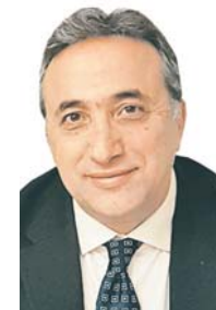
Γράφει ο Νίκος Εñευθερόγλου