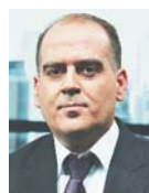
Γράφει ο Λουκάς Γεωργιάδης

α. Θα διαπιστώνουν τον χρόνο ασφάλισης σε έναν ή περισσότερους φορείς κύριας ή επικουρικής ασφάλισης και θα εκδίδουν σχετική βεβαίωση.