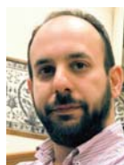
Γράφει ο Αλέξανδρος Διαμάντης

Σύμφωνα με πηγές της αξιωματικής αντιπολίτευσης, το εν λόγω έγγραφο αποτελεί προϊόν νέων διαπραγματεύσεων που πραγματοποιήθηκαν στις 6/5/2018, στην οικία του Χούρι στην Πολιτεία, με σκοπό να βρεθεί η φόρμουλα, προκειμένου να