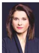
Γράφει η Αμαλία Κάτζου