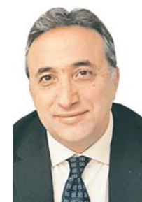
Γράφει ο Νίκος Ελευθερόγλου

Η πρόκληση που καλούμαστε να αντιμετωπίσουμε ως χώρα και ως Δύση 54 χρόνια μετά το πραξικόπημα της 21ης Απριλίου είναι μεγάλη. Διότι αυτήν τη φορά τις δημοκρατίες δεν τις απειλούν τα τανκς, αλλά ο... μεγάλος αδελφός.