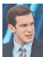
Γράφει ο Γιώργος Ευγενίδης

«Είναι πλέον εμφανές ότι οι απόψεις του κ. Τζανακόπουλου είναι οι απόψεις του κ. Πολάκη, που είναι οι απόψεις του κ. Τσίπρα και οι απόψεις όλου του ΣΥΡΙΖΑ. Δεδομένου ότι η Ελλάδα είναι ένα ευνομούμενο κράτος, όπου οι -κατά ΣΥΡΙΖΑ- «αρμοί της εξουσίας» λειτουργούν ο καθένας ανεξάρτητα, τέτοιες εκφράσεις και διατυπώσεις δείχνουν την καθεστωτική αντίληψη του ΣΥΡΙΖΑ, ο οποίος, μάλιστα, έχει απειλήσει ότι τη "δεύτερη φορά" θα είναι αλλιώς. Δείχνουν ότι το "ή τους τελειώνουμε ή μας τελειώνουν" και αυτή η καθεστωτική αντίληψη περί αρμών της εξουσίας είναι κεντρική πολιτική γραμμή του ΣΥΡΙΖΑ», υπογράμμισε χθες με νόημα η κυβερνητική εκπρόσωπος