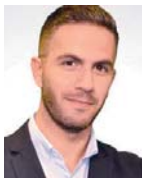
Γράφει ο Σταύρος Ιωαννίδης

Σ ε πλήρη εξέλιξη βρίσκονται οι διεργασίες της άτυπης πενταμερούς διάσκεψης για το Κυπριακό, που ξεκίνησε χθες στη Γενεύη. Η πρώτη ημέρα ολοκληρώθηκε με τις διαδοχικές διμερείς συναντήσεις ανάμεσα στον γενικό γραμματέα του Οργανισμού Ηνωμένων Εθνών, Αντόνιο Γκουτέρες, και τους ηγέτες των δύο κοινοτήτων, ενώ ακολούθησε το δείπνο προς τιμήν των εμπλεκόμενων όλων των μερών.