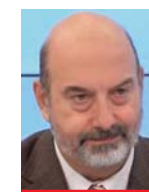
Γράφει ο Διαμαντής Σεϊτανίδης

Σύμφωνα με τους προκλητικούς και ανυπόστατους ισχυρισμούς Ερντογάν, όπως τους μεταφέρει η «Daily Sabah», συμμορίες Αρμενίων (τις οποίες ο Τούρκος πρόεδρος υπολόγισε σε 150.000 με 300.000) έσφαζαν Τούρκους σε εδάφη τουρκικά. «Οι Αρμένιοι», συνέχισε ο Ερντογάν, «σε συνεργασία με ρωσικές δυνάμεις πολε-