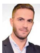
Γράφει ο Σταύρος Ιωννίδης

Φρεγάτες, ταχεία σκάφη κατευθυνόμενων βλημάτων και αποβατικές δυνάμεις έλαβαν μέρος σε μια σειρά από σενάρια αεροναυτικού πολέμου στο Βόρειο και Κεντρικό Αιγαίο, το Μυρτώο και το Κρητικό Πέλαγος αλλά και στη θαλάσσια περιοχή των Κυθέρων με τις παράλληλες ασκήσεις «Λαίλαπα» και «Αιγιαλός». Τα πλοία του Στόλου δοκίμασαν το σύνολο των αντιαεροπορικών τους όπλων σε κοινά σενάρια με τα αεροσκάφη που συμμετείχαν στον «Ηνίοχο», πετυχαίνοντας μάλιστα και εικονική κατάρριψη «εχθρικών» μέσων.