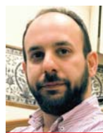
Γράφει ο Αλέξανδρος Διαμάντης

Μάλιστα, ο ίδιος ζήτησε απ' όλους να «λάβουν θέσεις μάχης», προϊδεάζοντας για τη στρατηγική του ΣΥΡΙΖΑ αμέσως μετά το Πάσχα, όταν πιθανότατα θα κατατεθεί το σχέδιο νόμου. «Διότι η κυβέρνηση αποφάσισε -παρά το ότι είμαστε ακόμη στην κορύφωση του δράματος της πανδημίας- να κηρύξει τον πόλεμο στην εργασία, δηλαδή τον πόλεμο στην κοινωνική πλειοψηφία. Και όταν κηρύσσεται πόλεμος, δεν υπάρχει άλλη επιλογή από το